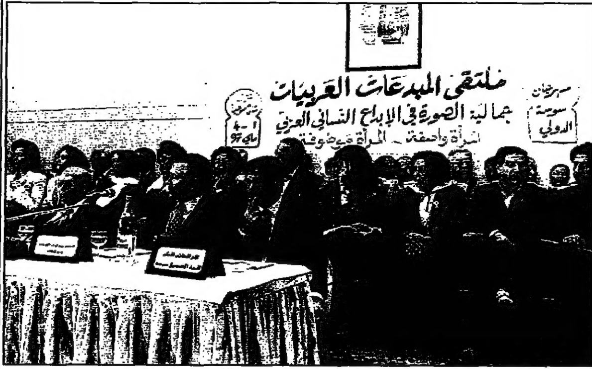
جلسة افتتاح التي حضرها وزير الثقافة التونسي د. عبد الباقي المرحوم بحضور نخبة من شيوخ الشرف